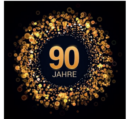
Hildegard Venetz-Anthamatten 2. Oktober 2023